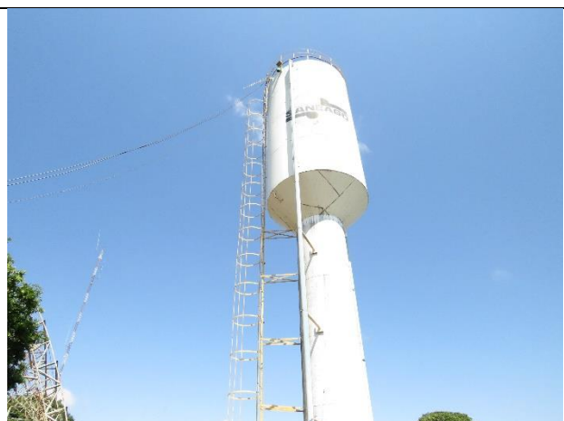
Autor: AMAE Descrição: REL em condições adequadas.