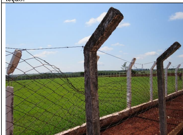
Autor: AMAE Descrição: Parte da cerca que cedeu.