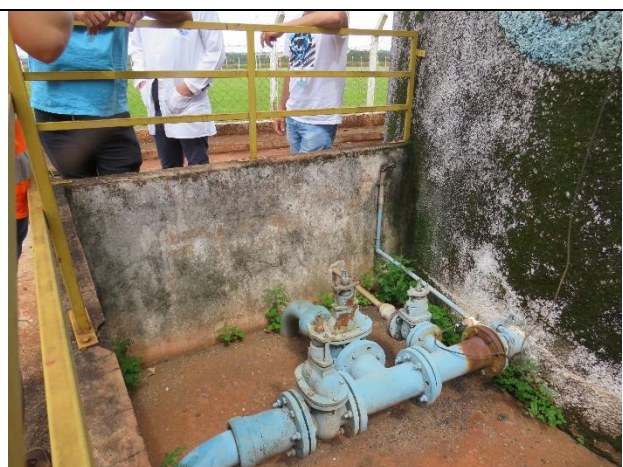
Autor: AMAE Descrição: Tubulação de saída do RAP.